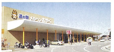
4 道の駅メルヘンおやべ

交通・観光情報コーナー：24時間 【農産物等売場開館】 9:00~19:00 年中無休 TEL 0766-68-3811