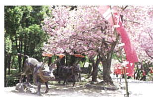
3 俱利伽羅 古戦場 火牛の像

■義仲・巴ナビステーション 【開館時間】10:00~18:00 TEL 0766-68-1062