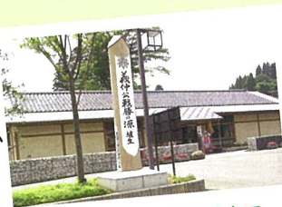
2 俱利伽羅源平の郷 埴生口

【開館時間】9:00~17:00 第3月曜日休館 TEL 0766-67-5645